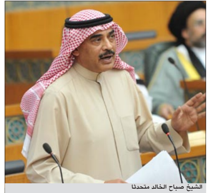
الشيخ صباح الخالد متحدثاً