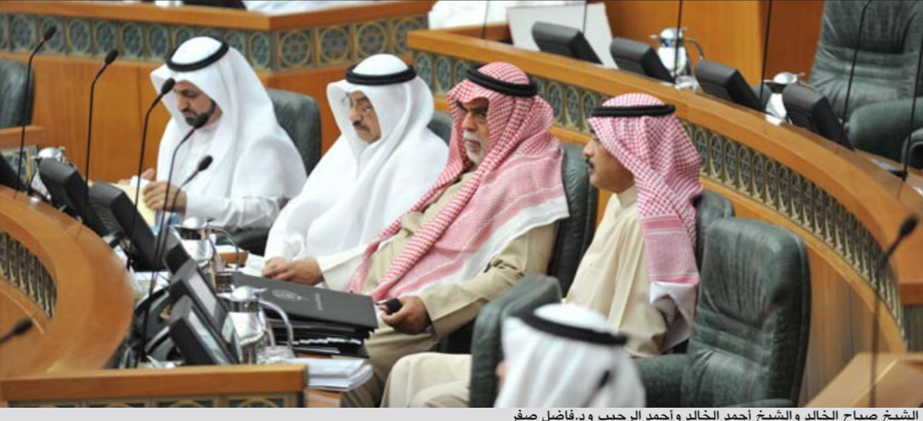
الشيخ صباح الخالد والشيخ أحمد الخالد وأحمد الرجيب ود.فاضل صفر