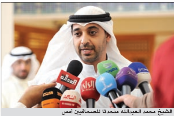
الشيخ محمد العبدالله متحدثاً للصحافيين أمس

وأعرب عن الشكر والتقدير للنائب القلاف الذي سيجتني من الرد على ما قدم لي من تساؤلات في الاستجواب، متمنياً في الوقت ذاته أن تصل الحقيقة لأهل الكويت وممثلهم في مجلس الأمة إن شاء الله..