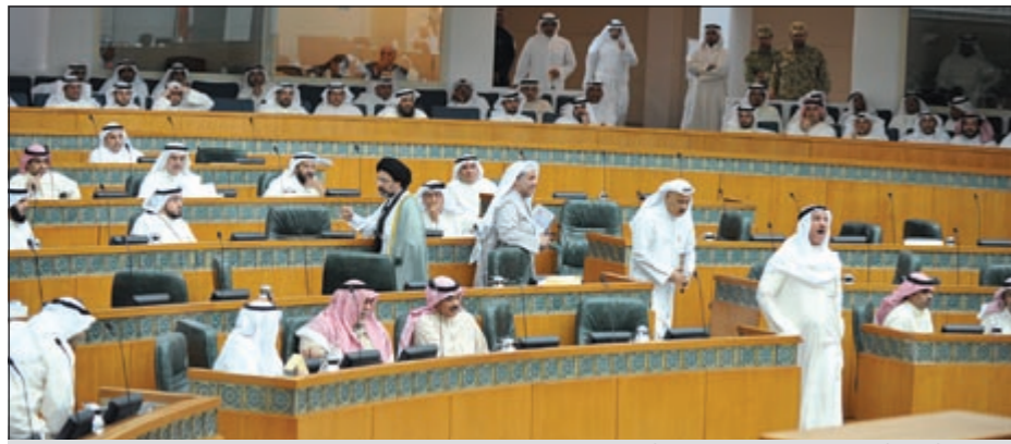
نواب الأقلية أثناء انسحابهم من جلسة أمس (متين غوزال)

الموافقة على قانون حماية المنافسة والتصويت على الخطة السنوية الثانية بالمدولة الأولى القلق يستجوب وزير الإعلام.. والمجلس يقرّ 50 مليوناً لدعم الطلبة الدارسين في الخارج على نفقتهم