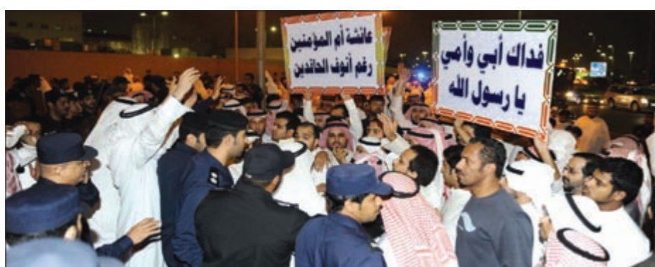
جانب من التجمع الاحتجاجي على الإساءة للرسول ﷺ والصحابة أمام «أمن الدولة» مساء أمس

من المواطنين قد تجمعوا مساء أمس أمام إدارة أمن الدولة لمطالبة «الداخلية» بواد الفتنه في مهدها والتعامل بحزم مع الموضوع.