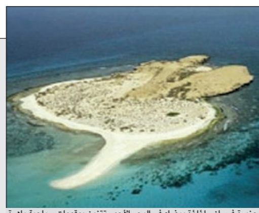
جزيرة فرسان.. لؤلؤة بيضاء في البحر الأحمر تزين بمقومات سياحية باهرة

www.alanba.com.kw كويتية • يومية • سياسية • شاملة