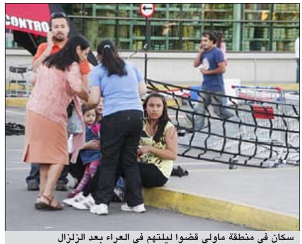
سكان في منطقة ماولي قضاوا ليلتهم في العراء بعد الزلزال

سانتياغو - أ.ف.ب: هز زلزال عنيف بقوة تتراوح بين 7.1 و7 درجات، حسب معهدين مختلفين، وسط تشيلي مساء الأحد متسبباً في سقوط عشرة جرحى وإجلاء سبعة آلاف شخص لبعض ساعات من المناطق الساحلية تحسباً لتعرضها إلى تسونامي. وأفاد المكتب الوطني للحالات الطارئة بأن نحو سبعة آلاف شخص نقلوا من المناطق الساحلية إلى المرتفعات التي تقع على مسافة 300 كلم جنوب سانتياغو. ووقع الزلزال الذي قال المعهد الجيوفيزيائي الأمريكي أن قوته بلغت 7.1 درجات، بينما أكدت دائرة الزلازل في تشيلي أنها بلغت 7.0، في الساعة 22:37 تغ على مسافة 32 كلم من مدينة تالكا