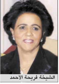
الشيخة فريحة الأحمد

دعت رئيسة الجمعية الكويتية للأسرة المثالية الشبيخة فريحة الأحمد إلى مساندة وتشجيع الحملة الوطنية للترويج عن المنتج الوطني والتي تحمل عنوان «منا وينا» التي أطلقتها الهيئة العامة للصناعة منذ بداية العام الحالي، مؤكدة على أن عنوان تلك الحملة يؤكد على ما تحمله من أهداف وطنية لتشجيع المنتج الكويتي والترويج له.