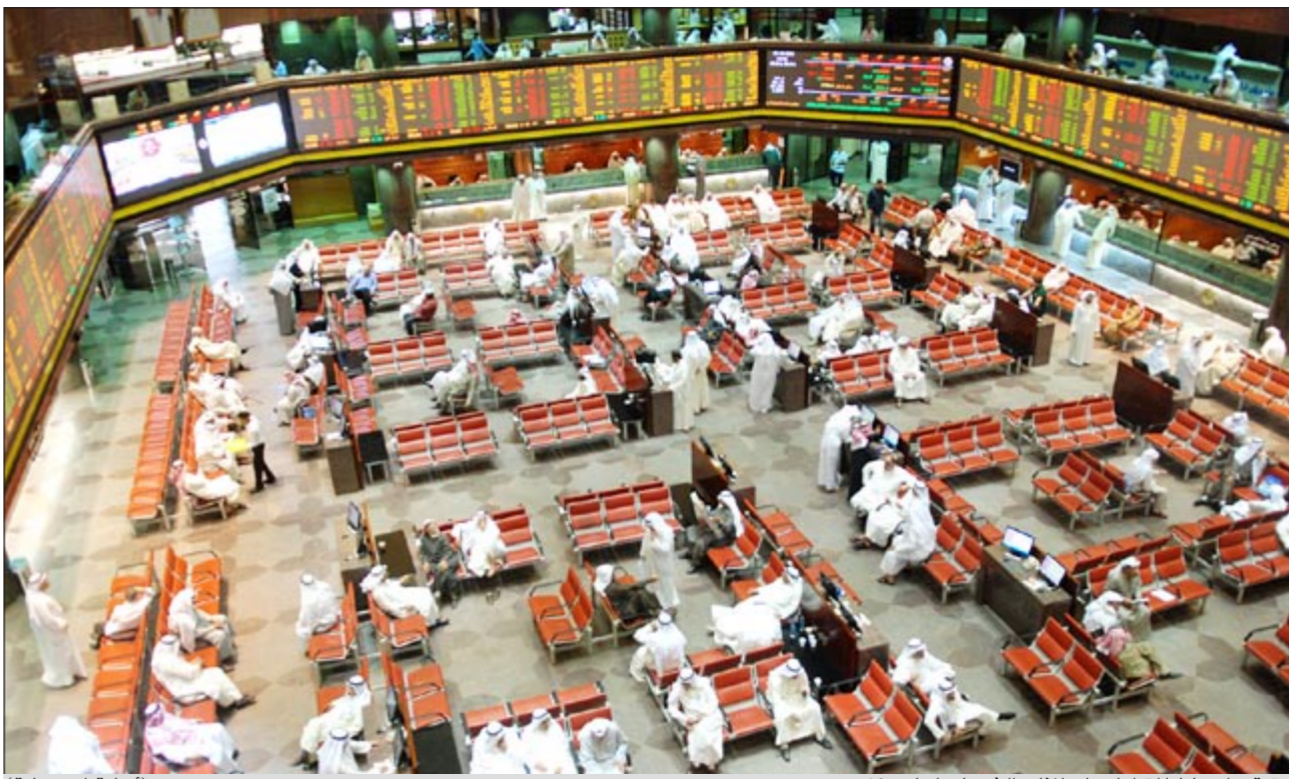
تقرب اوساط المتداولين لإعلانات الشركات لعام 2011 (أسامة ابو عطية)

استهل سوق الكويت للأوراق المالية تعاملات الأسبوع على تراجع مؤشريه بعد جلسة جنحت بشكل واضح السى الانخفاض منذ بدايتها جراء عمليات بيع شملت كثيرا من الأسهم في أغلب القطاعات، وخاصة الخدمات والاستثمار والبنوك.