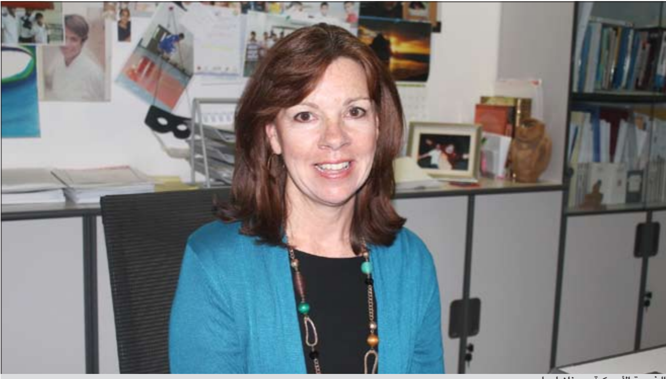
الخبيرة الأميركية سوزان لويل

● لدينا ثلاثة مستويات للعسر القرائي متفاوتة الدرجات من الخفيف والمتوسط إلى الشديد، والعسر القرائي كصعوبة من صعوبات التعلم يحتاج لاسلوب مختلف في التدريس وتكرار وزيادة في جرعات الدراسة على حسب الحاجة ومدى التجاوب ومستوى التقدم، فإذا كانت المدرسة مستعدة لذلك من خلال الامكانيات المادية والبشرية والقدرة على توفير برنامج مسائي لمتابعة الطلاب فلا مانع من اتباع الدمج التعليمي.