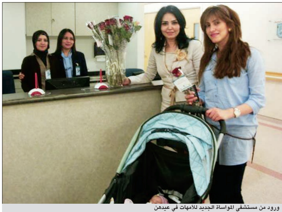
ورود من مستشفى المواساة الجديد للأمهات في عيدهن

احتفل مستشفى المواساة الجديد كعادته كل عام بعيد الأم والذي صادف في بداية فصل الربيع من كل عام والموافق 21 مارس كرمز للعطاء والصفاء والخير الذي يجمع بين الأم والربيع، مقدما زهرة لكل أم كهدية تقديرية معبرة عن اهتمامه وتقديره للأمهات، وإيمانا بدور الأمهات الرئيسي في بناء وتربية الأجيال حيث يشكلن نصف المجتمع.