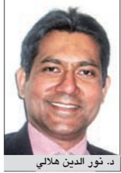
د. نور الدين هلاي

يعلن مستشفى السيف عن الزيارة الأولى للدكتور نور الدين هلاي - استشاري جراحة العمود الفقري FRCS في هاري ستريت كلينك - لندن ومحاضر فخري في المستشفى الملكي الوطني لتقويم العظام (لندن). وقالت مديرة التسويق والعلاقات العامة في مستشفى