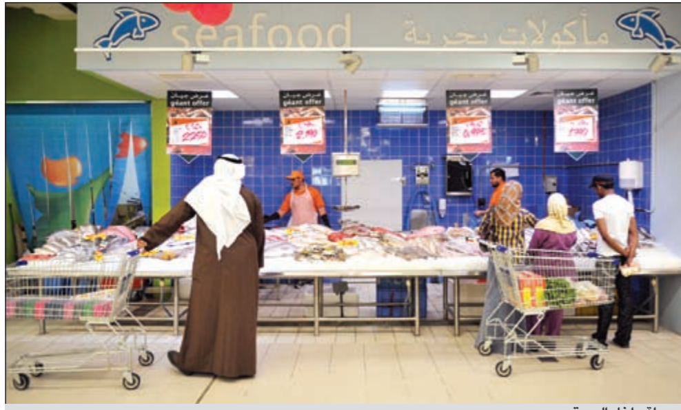
جولة داخل السوق