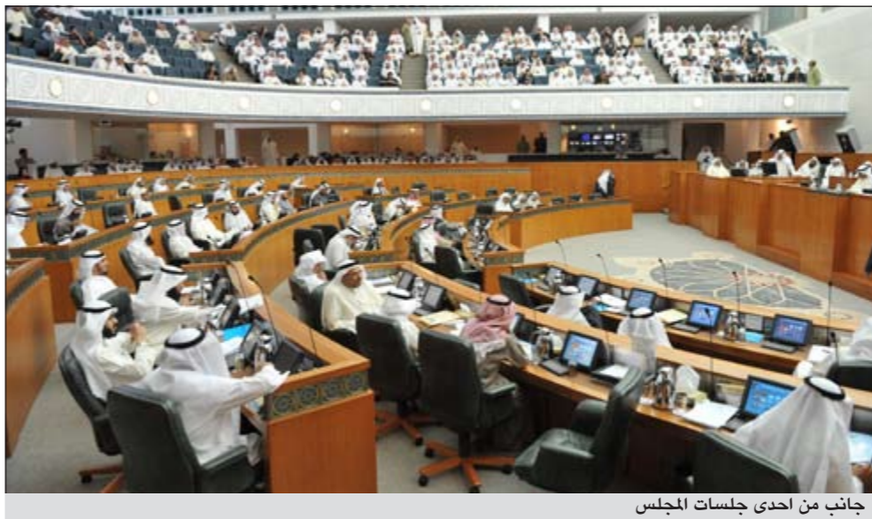
جانب من إحدى جلسات المجلس