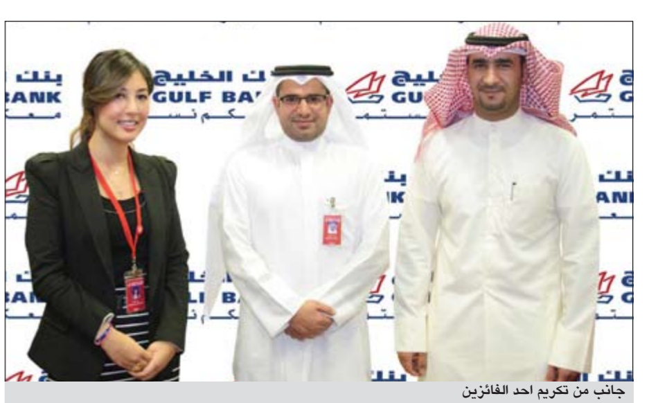
جانب من تكريم احد الفائزين

أجرى بنك الخليج في 18 مارس 2012 السحب الأسبوعي الحادي عشر لحساب الدانة 2012 معلناً بذلك عن أسماء 10 فائزين يحصل كل منهم على جائزة قدرها 1000 دينار.