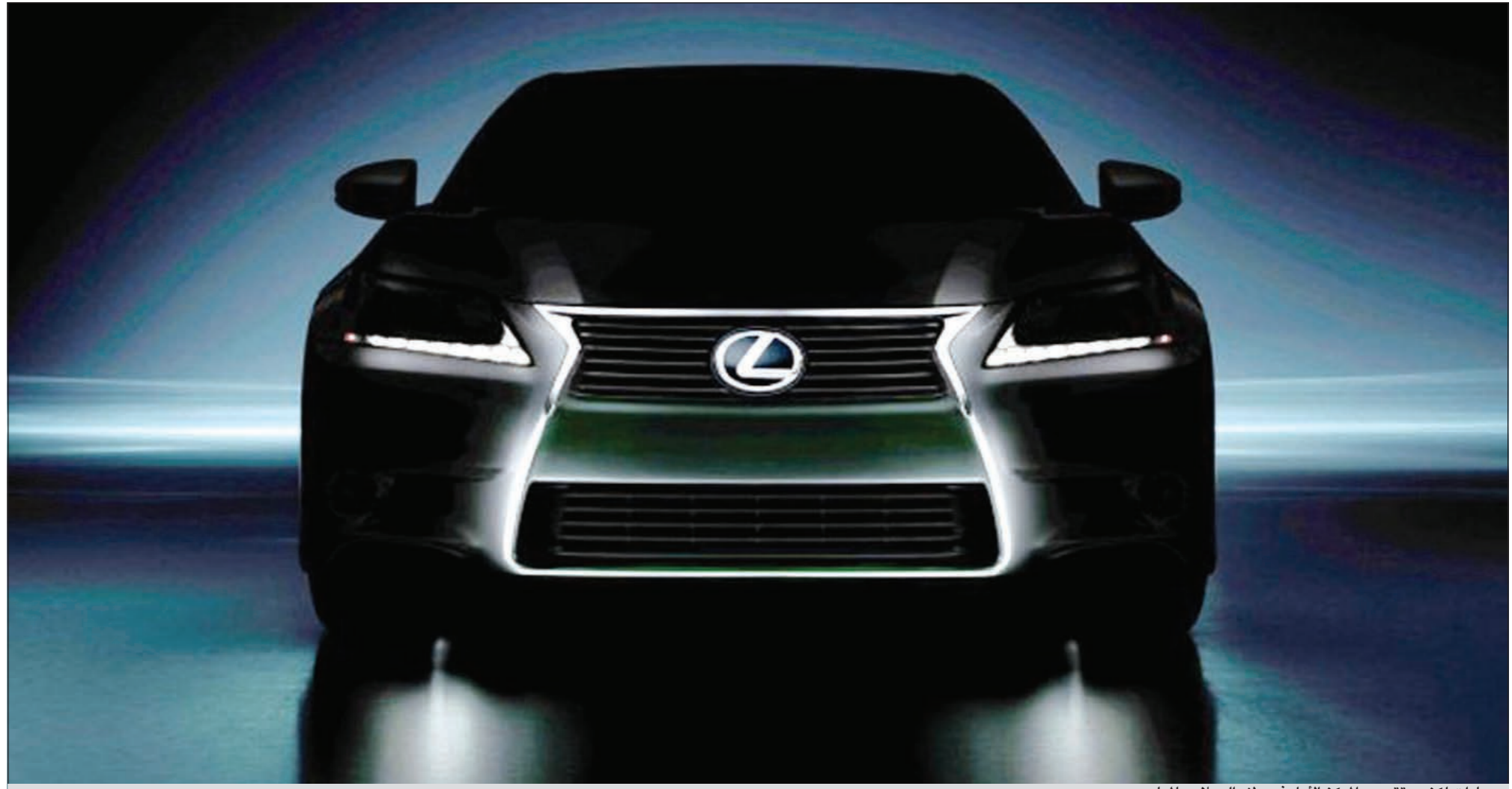
سيارات لكزس تتصدر المركز الأول في ولاء العملاء عالمياً