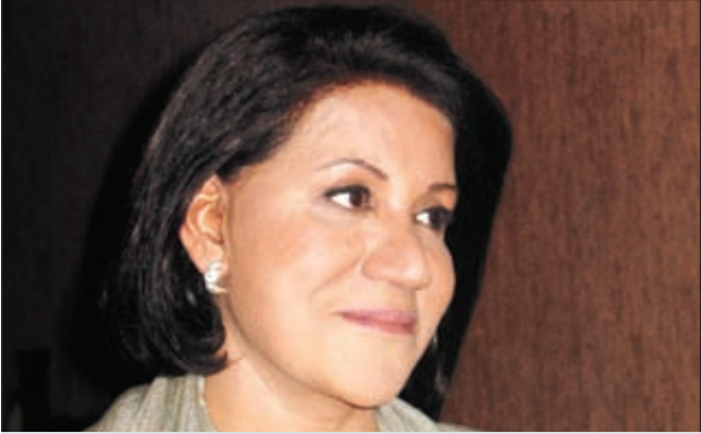
الفنانة القديرة سعاد عبدالله