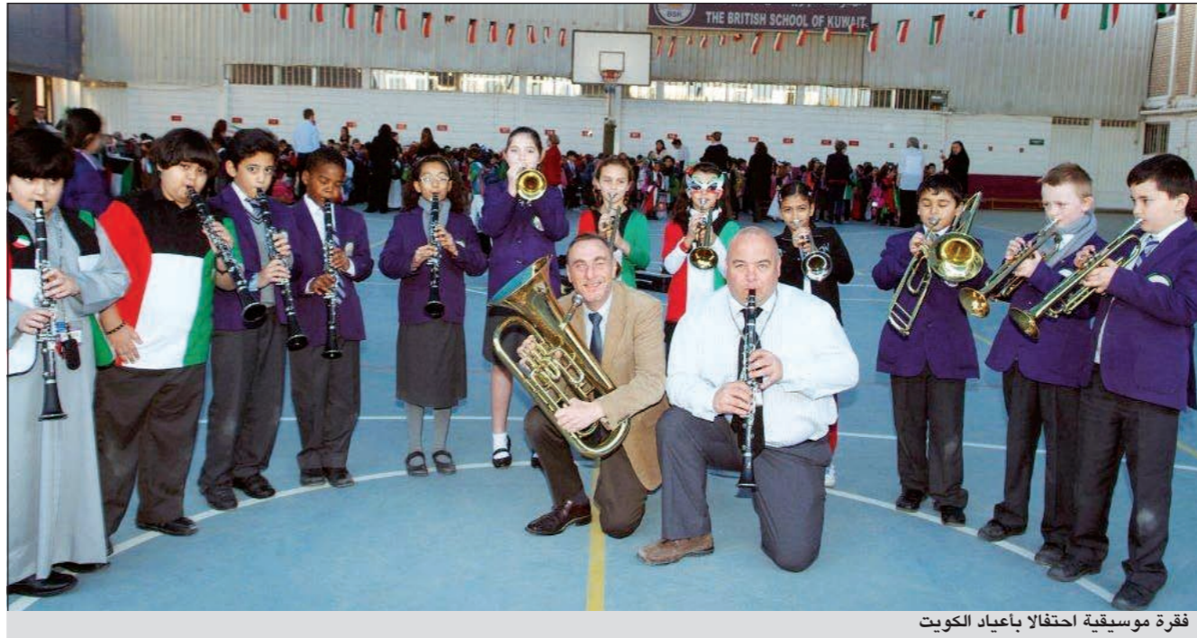
فقره موسيقية احتفالاً بأعياد الكويت

المضيفة والتي أصبحت بمثابة وطنهم الثاني الذي منحهم حق التعليم والمعيشة. وبهذه المناسبة، كان لسوق الموضة هذا العام نكهة خاصة ومميزة حيث تنوعت تشكيلة الملابس من أغطية الرأس بما في ذلك الشالات، والريش، والقبعات بمختلف الأحجام والأشكال، وكذلك الزي التقليدي كالدشداشة والثوب الكويتي، كان الطلاب الأكبر سناً أكثر تحفظاً في لباسهم، وبالرغم من