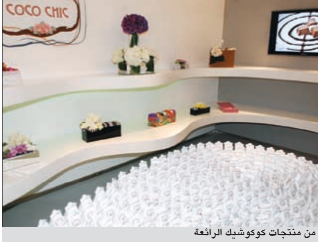
من منتجات كوكوشيك الرائعة