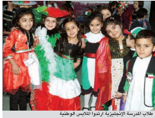
طلاب المدرسة الإنجليزية ارتدوا الملابس الوطنية