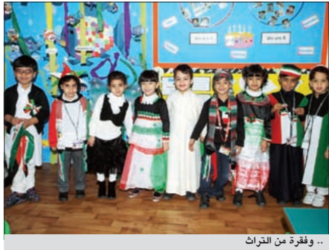
.. وفقره من التراث

بعد العياد الوطني والتحرير من أهم أحداث السنة التي نحتفل بهما في المدرسة البريطانية بالكويت، ففي هذه المناسبة، يحتفل جميع الطلاب الكويتيين وغير الكويتيين بارتدائهم الزي الوطني الكويتي ذا الألوان البهية والتي تضيء السرور والبهجة على جميع أنحاء المدرسة، ويتجمع ما يقارب السبعين جنسية من مختلف الدول مع بعضها البعض كعائلة واحدة لتشريف الكويت