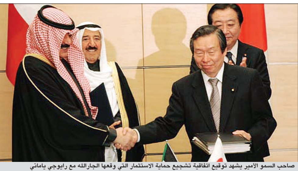
صاحب السمو الامير يشهد توقيع اتفاقية تشجيع حماية الاستثمار التي وقعها الجارالله مع رايوجي ياماني

وقال ان ثمار هذا التعاون ظهرت في مجالات ذات صلة بصناعة تكرير النفط ومعالجة مشكلات التآكل وعمليات التحفيز والمعالجة البيولوجية للتربة. في السياق ذاته وعلى شرف