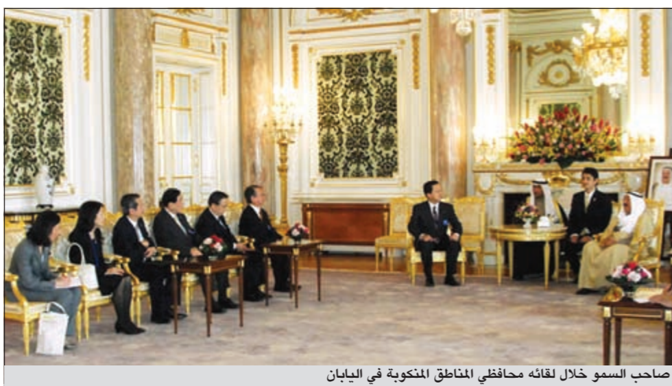
صاحب السمو خلال لقاؤه محافظي المناطق المنكوبة في اليابان

واكد الشيخ صباح الخالد ان هذا التبرع من سمو الامير للشعب الياباني الصديق امر ليس بغريب على سموه الذي يهتم بالنواحي والجوانب الإنسانية في جميع دول العالم في حالات الكوارث الطبيعية وغيرها.