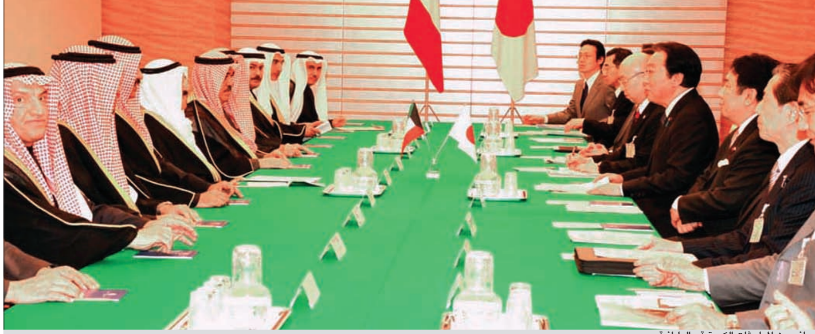
جانب من المباحثات الكويتية - اليابانية

طوكيو - كونا: اعرب رئيس اتحاد منظمات الشركات اليابانية الكبرى هيروماسا يونيكورا امس عن املة في ان تعزز الشركات اليابانية من تعاونها مع الكويت في قطاعي الكهرباء والنقل بالإضافة الى مشروعات البنى التحتية الأخرى. ودعا يونيكورا في مقابلة مع «كونا» والتلفزيون الكويتي عقب اجتماعه بصاحب السمو الأمير الشيخ صباح الاحمد، الى تعزيز العلاقات الاقتصادية بين الكويت واليابان. وأكد يونيكورا استعداد اليابان للاستمرار في الحوار مع الكويت من اجل تعزيز التعاون الثنائي في مجالات اوسع نطاقا، وأشار الى انه اطلع صاحب السمو الامير على الاوضاع الحالية للاقتصاد الياباني خاصة في اعقاب الزلزال المدمر الذي ضرب اليابان.