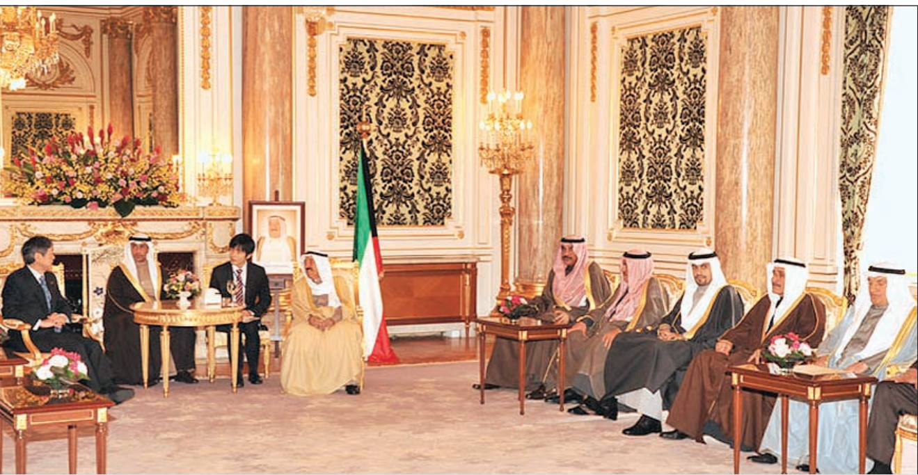
صاحب السمو الامير مستقبلا اعضاء جمعية الصداقة اليابانية - الكويتية بالحزب الليبرالي الديموقراطي