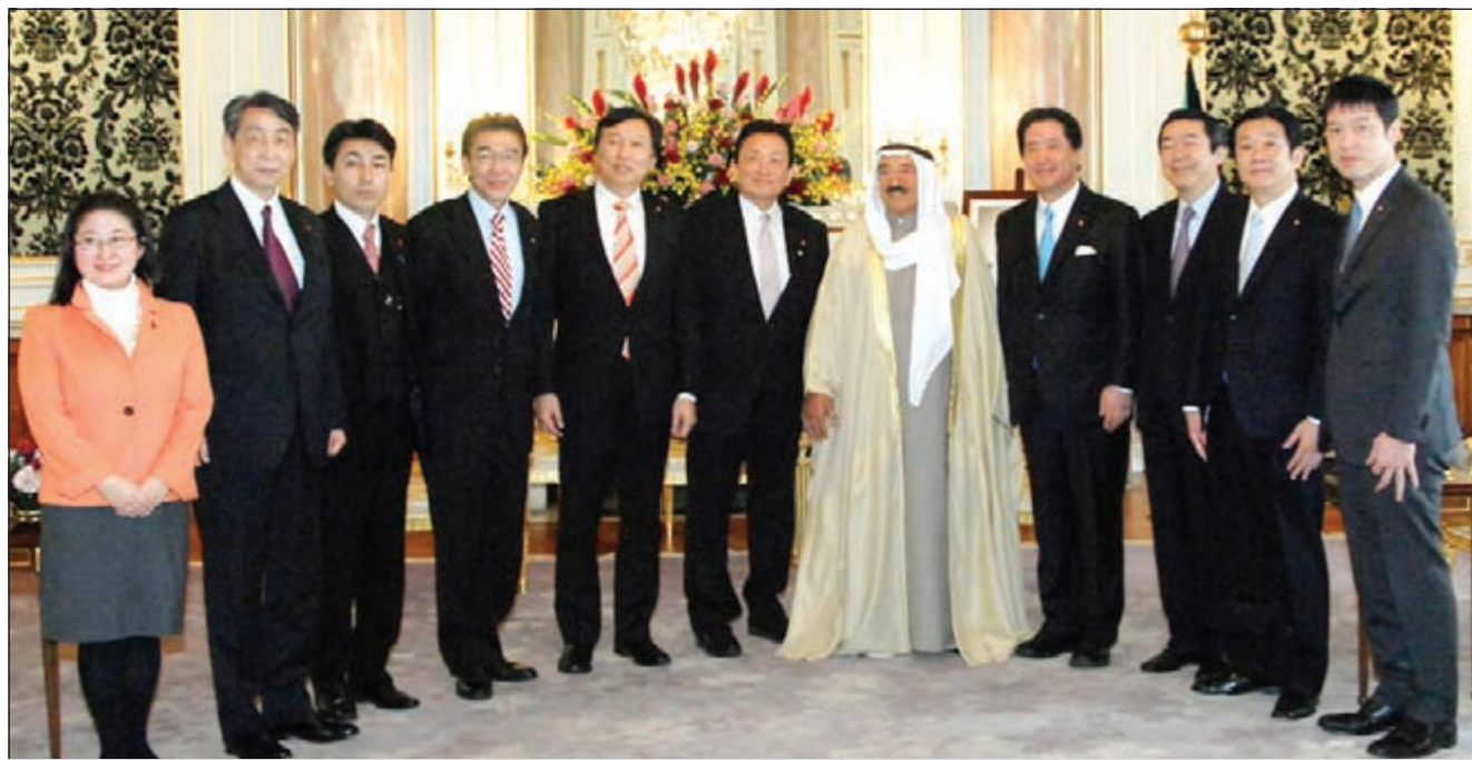
صاحب السمو خلال لقاؤه اعضاء جمعية الصداقة البرلمانية اليابانية - الكويتية بالحزب الديموقراطي الياباني

ونكر انه من المتوقع ان يتم خلال الزيارة توقيع على عدد من الاتفاقيات المشتركة التي تصب في صالح تعزيز العلاقات الثنائية. وقال السفير الكندري ان المسؤولين في الحكومة الفلبينية قد عبروا له