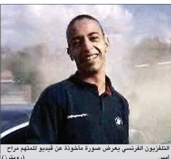
التلفزيون الفرنسي يعرض صورة مأخوذة عن فيديو لهمتهم مراح

تولوز - وكالات: بعد محاصرته في منزله لقرابة 32 ساعة، قتل أمس خلال هجوم للمشرطة الشاب الفرنسي من أصل جزائري محمد مراح الذي يشتبه بارتكابه ثلاث هجمات وقعت سبعة قتلى بينهم ثلاثة عسكريين وثلاثة أطفال يهود في جنوب غرب فرنسا. فبعد ساعات من انتظار الشرطة، اتت النهاية سريعة: سمعت ثلاثة انفجارات اقتحم بعدها بدقائق شرطيون من وحدة النخبة الشقة التي تقدموا داخلها «خطوة خطوة»، وقام مراح وسمع إطلاق نار كثيف بلغ 300 رصاصة. وفي نهاية الأمر قتله شرطيون بينما كان يحاول الفرار من شرفته شقته وهو يواصل إطلاق النار. وصرح الرئيس الفرنسي نيكولا ساركوزي بعد انتهاء المواجهة بأن «مواطننا المسلم لا علاقة لهم بالوفاة الجنونية لإرهابي»، وتعهد باتخاذ إجراءات جنائية لمكافحة محاولات «نشر العقائد» المتطرفة سواء على الانترنت أو في الرحلات أو حتى في السجون.