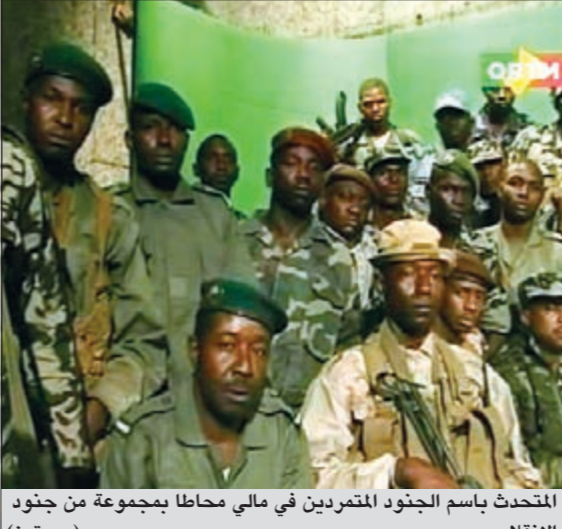
المتحدث باسم الجنود المتمردين في مالي محاطا بمجموعة من جنود الانقلاب

تولوز - وكالات: بعد محاصرته في منزله لقرابة 32 ساعة، قتل أمس خلال هجوم للمشرطة الشاب الفرنسي من أصل جزائري محمد مراح الذي يشتبه بارتكابه ثلاث هجمات وقعت سبعة قتلى بينهم ثلاثة عسكريين وثلاثة أطفال يهود في جنوب غرب فرنسا. فبعد ساعات من انتظار الشرطة، اتت النهاية سريعة: سمعت ثلاثة انفجارات اقتحم بعدها بدقائق شرطيون من وحدة النخبة الشقة التي تقدموا داخلها «خطوة خطوة»، وقام مراح وسمع إطلاق نار كثيف بلغ 300 رصاصة. وفي نهاية الأمر قتله شرطيون بينما كان يحاول الفرار من شرفته شقته وهو يواصل إطلاق النار. وصرح الرئيس الفرنسي نيكولا ساركوزي بعد انتهاء المواجهة بأن «مواطننا المسلم لا علاقة لهم بالوفاة الجنونية لإرهابي»، وتعهد باتخاذ إجراءات جنائية لمكافحة محاولات «نشر العقائد» المتطرفة سواء على الانترنت أو في الرحلات أو حتى في السجون.