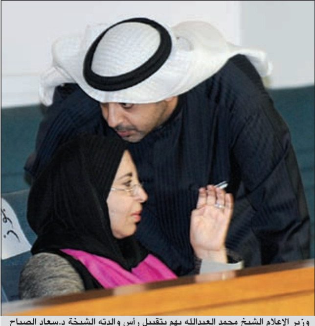
وزير الإعلام الشيخ محمد العبدالله يهنئ بتقبيل رأس والدته الشيخة د.سعاد الصباح