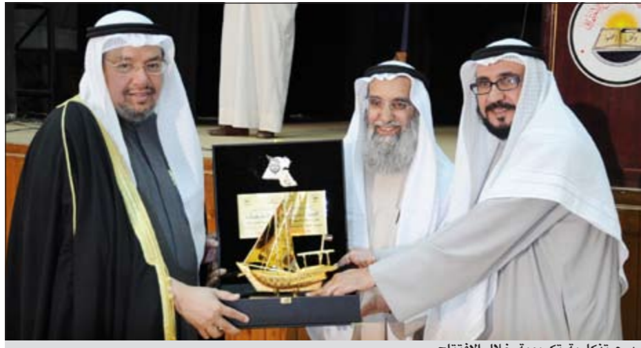
درع تذكارية تكريمية خلال الافتتاح

وأضاف الشهاب في كلمة ألقاها نيابة عنه وكيل وزارة الأوقاف والشؤون الإسلامية خلال افتتاح ملتقى «أسلمة القوانين.. رؤية مستقبلية» الذي نظمته جمعية الإصلاح الاجتماعي في الكويت تعتنز وتفخر بأن دينها الإسلام وان شعبها حريص على تطبيق أحكام الشريعة الإسلامية. وبين أن اللجنة الاستشارية للعمل على تطبيق أحكام الشريعة الإسلامية ليست أو كانت تفرق بين الدين الإسلامي وبين ما هو عليه في الواقع. وأكد أن الشريعة الإسلامية هي الأساس الذي تقوم عليه الدولة الإسلامية، ويجب أن تكون مبنية على دراسة الأمر الواقع لأن هناك مسلمين وغير مسلمين يعيشون في الكويت.