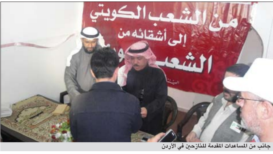
جانب من المساعدات المقدمة للنازحين في الأردن

عام 1984 بالتعاون والتنسيق مع جمعية المركز الإسلامي وجمعية الكتاب والسنة وفروعها المنتشرة في جميع المحافظات الأردنية. وأشاد مدير وجمعية المركز الإسلامي وجمعية الكتاب والسنة بالدور الفاعل الذي تلعبه الهيئة الخيرية الإسلامية العالمية من خلال زياراتها الإغاثية المستمرة للأسر السورية النازحة وإيصال تبرعات صاحب السمو الأمير الشيخ صباح الأحمد والشعب الكويتي الشقيق.