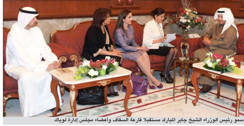
سمو رئيس الوزراء الشيخ جابر المبارك مستقبلاً فارة السقاف وأعضاء مجلس إدارة لويك

مرور 10 أعوام على إنشائها بمقرها بالمدرسة القبلية يوم الأربعاء 28 الجاري.