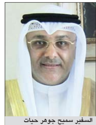
السفير سميح جواهر حيات

بعض النوافذ والزجاج وقطع الكهرباء والاتصالات في حين خرج الناس إلى الشوارع خشية أن تقع المباني على رؤوسهم. من جهة، أفاد رئيس حكومة المنطقة الفيدرالية وعمدة العاصمة مارسيلو أبرارد بأن الأجهزة الحكومية الفيدرالية تقوم حالياً بأقصى طاقاتها للطوارئ وتقوم حالياً بمسح شامل للمباني والمواقع الحيوية في العاصمة اثر تصدع كثير من المباني وذلك لتقييم الأضرار التي أحدثها الزلزال.