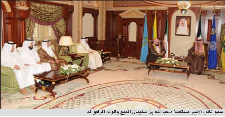
سمو نائب الأمير مستقبلاً د.عبدالله بن سليمان المنيع والوفد المرافق له

الوطن العزيز الكويت عاليا في المحافل الثقافية والإقليمية والدولية، متمنيا لها دوام التوفيق والنجاح.