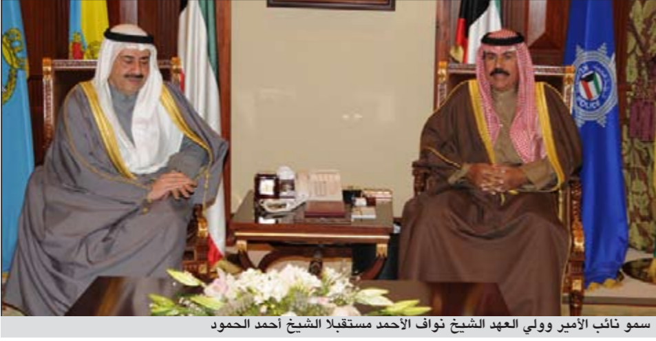
سمو نائب الأمير وولي العهد الشيخ نواف الأحمد مستقبلاً الشيخ أحمد الحمود