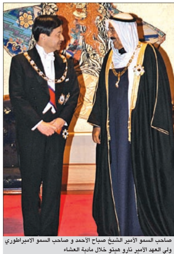
صاحب السمو الأمير الشيخ صباح الأحمد وصاحب السمو الإمبراطوري ولي العهد الأمير نارو هيتو خلال مأدبة العشاء

في أعقاب إجراء الإمبراطور عملية إزالة سائل من صدره الأمير بحث مع إمبراطور اليابان العلاقات الثنائية والقضايا المشتركة