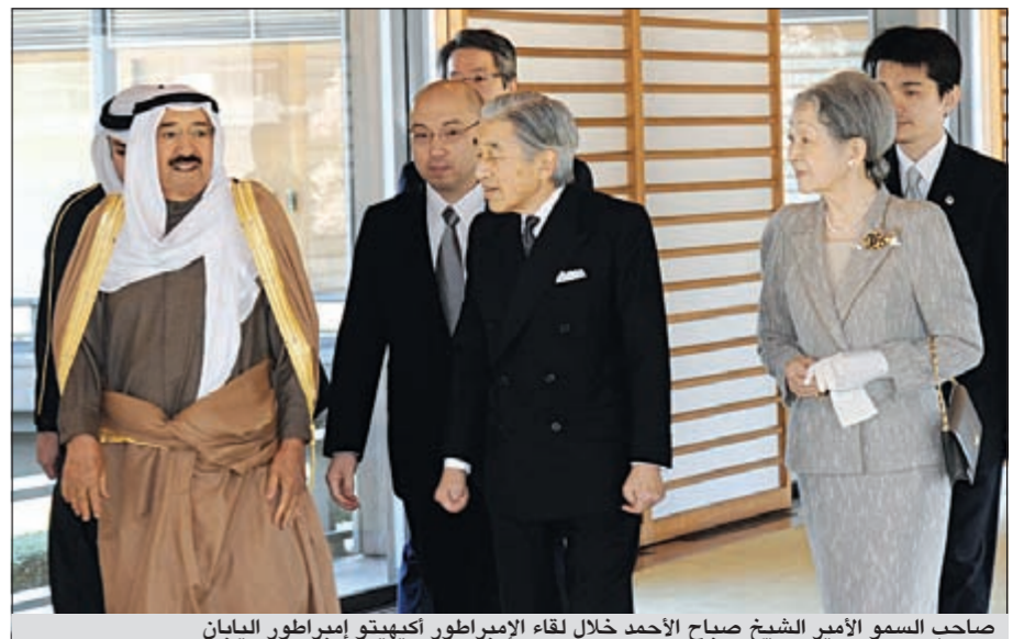
صاحب السمو الأمير الشيخ صباح الأحمد خلال لقاء الإمبراطور اكيهيتو إمبراطور اليابان

أصدر وزير الشؤون الاجتماعية والعمل الفريق أحمد الرجيب قراراً وزارياً بتعيين عبدالعزیز العوضي مديراً لإدارة العلاقات العامة بالوزارة، ونقل مدير الإدارة السابق علي الملا إلى منصب مدير إدارة في مكتب وكيل الوزارة محمد الكندري.