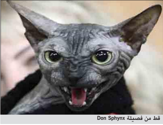
قط من فصيلة Don Sphynx

وكالات: حظى قط من فصيلة Don Sphynx بمئات المعجبين في معرض للقطط في بيشيك بجمهورية قرغيزستان مؤخراً، على الرغم من عدم اختلاف الحيوانات المشاركة في المعرض كثيراً عن الأشباح أو الغفارت وفقاً لصحيفة «الدبلي ميل» البريطانية الأحد الماضي.