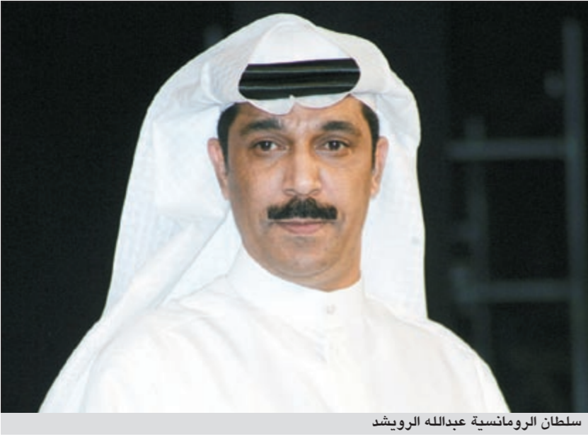
سلطان الرومانسية عبدالله الرويشد

الغزل من سمعته وتشويه صورته. وأمل الفنان من كافة وسائل الإعلام والمواقع الإلكترونية توخي الدقة عند نشر أي خبر بهذا الخصوص، وأعلن مكتبه الإعلامي أنه قد تم تكليف وكيله القانوني، لاتخاذ كل الإجراءات القانونية لملاحقة كل من قام بتلفيق وترويج ونشر الخبر الكاذب المبين أعلاه.