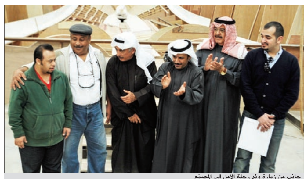
جانب من زيارة وفد رحلة الأمل إلى المصنع

الوصول إلى واشنطن (دي سي) في الولايات المتحدة الأمريكية، حيث المقر الرئيسي للأولمبياد المعني عالمياً بفترة ذوي الإعاقات الذهنية. وستعمل الرحلة خلال انطلاقتها وعودتها، على إبراز دور الكويت الإنساني، ووجهها المشرق الحضاري أمام دول العالم، ونقل تجربتها الفريدة في مجال رعاية ذوي الاحتياجات الخاصة عموماً وذوي الإعاقات الذهنية على وجه الخصوص. يذكر أن فكرة الرحلة بدأت مع مجموعة من أولياء الأمور الذين اكتسبوا الخبرة من التعامل مع أبنائهم من ذوي الاحتياجات الخاصة، وأرادوا مشاركة تجاربهم مع الآخرين الذين لديهم المشاكل نفسياً مع أبنائهم، ومن هنا كونوا الفريق الخاص الذي قام بفعاليات اجتماعية توعوية عدة موجهة لصالح ذوي الاحتياجات الخاصة.