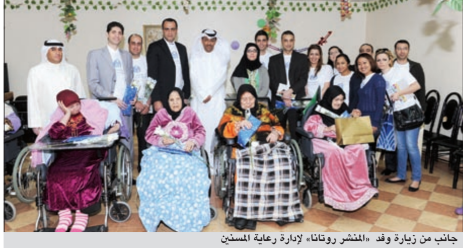
جانب من زيارة وفد «المنشر روتانا» لإدارة رعاية المسنين