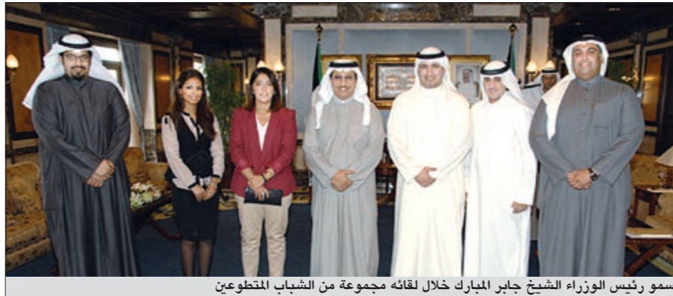
سمو رئيس الوزراء الشيخ جابر المبارك خلال لقائه مجموعة من الشباب المتطوعين

مريم بندق - حسين الرمضان اسامة ابوالسعود - سامح عبد الحفيظ عبد الهادي العجمي