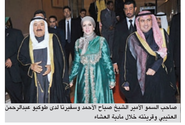
صاحب السمو الأمير الشيخ صباح الأحمد وسفيرنا لدى طوكيو عبدالرحمن العتيبي ورفيقتة خلال مأدبة العشاء

أولى ثمار هذا النجاح الحكومي كانت إعلان نقابتي الجمارك والكويتية تعليق إضرابيهما المستمر منذ عدة أيام وإعلان نقابة الإعلام إلغاء إضرابها الذي كان مقرراً اليوم. ولليوم الثاني على التوالي ترأس سمو رئيس الوزراء الشيخ جابر المبارك اجتماعاً للجنة متابعة تطورات الإضرابات، مؤكداً أن المطالب التي تطرحها بعض الجهات الحكومية مشروعة ومقبولة ومن واجب الجهات المعنية النظر فيها بعين عدالة تراعي المصلحة العامة وتلتزم بالقانونية. حضر اجتماع اللجنة بعض قيادات هذه الجهات وعدد من العاملين فيها الذين أبدوا استيائهم من التطورات