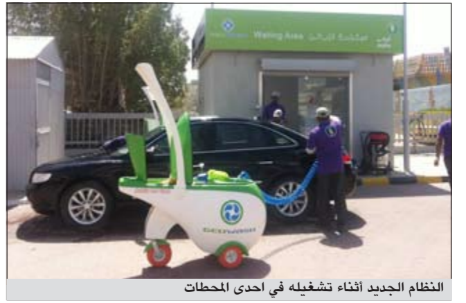
النظام الجديد أثناء تشغيله في إحدى المحطات

أطلقت الشركة الأولى لتسويق الوقود حصريا وللمرة الأولى في الكويت، نظام غسيل للسيارات اليدوي Geowash الذي يتميز بمواصفات المحافظة على البيئة وفق المعايير العالمية، على أن يكون الإطلاق الأولي في محطتي شرق (101) وكيفان (50) ليجمع بعدها على جميع محطات الأولى، وذلك انطلاقا من حرصها الدائم على تطوير خدماتها، وسعيها منها للحفاظ على البيئة. ويلعب نظام Geowash دورا محوريا في إضافة قيمة فعالة على خدمات محطات الأولى لتسويق الوقود، حيث يوفر النظام الجديد تكنولوجيا مبتكرة لغسيل السيارات عبر استخدامه مواد كيميائية صديقة للبيئة وقابلة للتحلل.