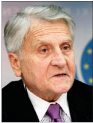
جان كلود تريشييه

نكرت شركة الصاحبة العقارية أنها قامت بتوقيع اتفاقية تمويل إسلامي بقيمة 10 ملايين دينار مع بنك محلي، وذلك ضمن خطط الشركة الرامية إلى تحويل الالتزامات قصيرة الأجل إلى التزامات طويلة الأجل، والعمل على تطبيق سياسة الشركة الهادفة إلى أن تكون جميع قروضها والتزاماتها المالية متوافقة مع متطلبات الشريعة الإسلامية.