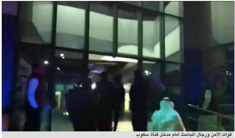
قوات الأمن ورجال المباحث أمام مدخل قناة سكوب

وتابع العازمي ما ورد على لسان النائب حسين القلاف خلال لقائه ليلة أمس مع تلفزيون سكوب عندما تطرق للمهاجمة شخصية ريفية المستوى من قبيلة العوازم، وقال ابن مطيع: نرفض الاسلوب السمج والاستفزازي الذي تحدثت به القلاف مستهزئاً بأمير قبيلة العوازم الشيخ فلاح بن جامع ولا يظن بأنه عندما لا يذكر الاسم مباشرة فإنه يتذكى على الشعب الكويتي والأمة بل لقد وضع قدمه في مستنقع الفتنة وضرب القبائل الكويتية، والتعدي على القبائل والعوائل والمذاهب، مما يثير الفتنة ويشق الوحدة الوطنية، ولا يمكن السكوت عنه.