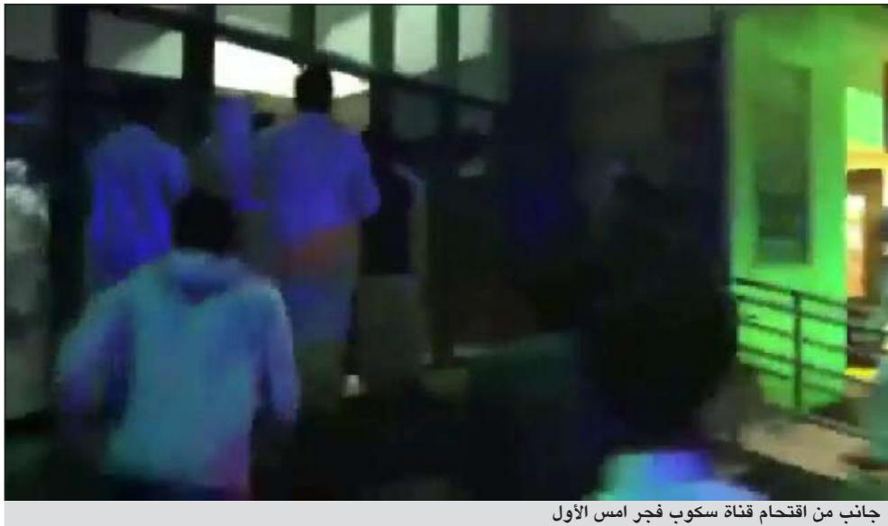
جانب من اقتحام قناة سكوب فجر أمس الأول