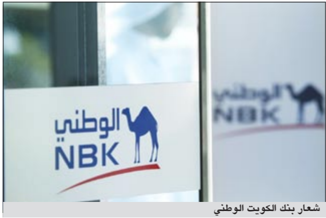
شعار بنك الكويت الوطني

استراتيجية في بنك بوبيان والمجموعة الأوسع من المنتجات الاستثمارية التي تقدمها ذراعها الاستثمارية «إي بي كي كابيتال»، بالإضافة إلى التوسع الإقليمي والدولي الذي وفر له مجالات جديدة للنمو».