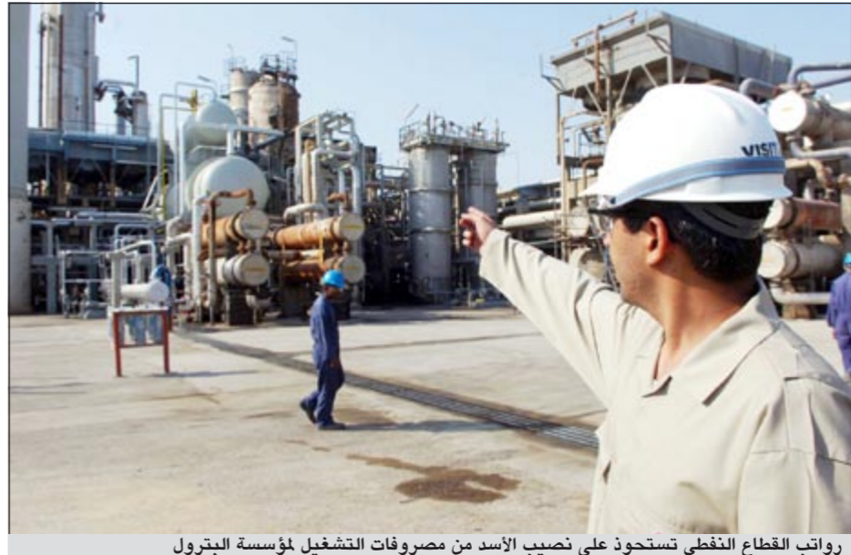
رواتب القطاع النفطي تستحوذ على نصيب الأسد من مصروفات التشغيل لمؤسسة البترول

كشف مصدر نفطي رفيع المستوى لـ «الأنباء» أن اللجنة المالية المنبثقة من المجلس الأعلى للبترو ستجتمع بعد غد الأربعاء لاعتماد ميزانية مؤسسة البترول الكويتية للعام 2012/2013 تمهيدا لرفعها للمجلس الأعلى للبترو باعتمادها في شكلها النهائي ومن ثم رفعها لمجلس الأمة لاعتمادها.