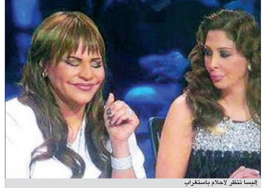
إليسا تنظر لأحلام باستغراب