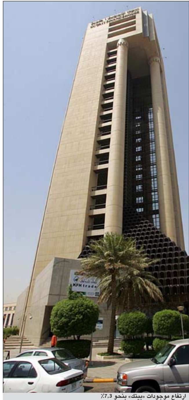
ارتفاع موجودات «بيتك» بنحو 7,3%

6 مليون دينار، في عام 2010، إلى نحو 55,9 مليون دينار، وهو ما يمثل تراجعاً بنسبة 14,2%، وارتفعت الموجودات التشغيلية بنحو 13,1 مليون دينار أي نحو 2,4% حين بلغت نحو 550,8 مليون دينار مقارنة مع 537,7 مليون دينار في عام 2010، وسبب هذا النمو هو الارتفاع في بند الاستهلاك بنحو 31,2 مليون دينار أي نحو 64,7% حين بلغ نحو 79,4 مليون دينار مقارنة مع 48,2 مليون دينار في العام السابق، وارتفع، أيضاً، بند تكاليف موظفين بنحو 10,2 ملايين دينار أي نحو 8,9% حين بلغت نحو 124,3 مليون دينار مقارنة مع 114,1 مليون دينار، بينما تراجعت توزيعات المودعين بنحو 47,6 مليون دينار أي نحو 19,9% حين بلغت 191,5 مليون دينار مقارنة مع 239,2 مليون دينار في العام السابق. من جانب آخر، ارتفع مجموع موجودات «بيتك» بنحو 911,3 مليون دينار، أي بما نسبته 7,3% لبلغ نحو 13459,5 مليون دينار، مقابل نحو 12548,5 مليون دينار، في عام 2010، ويعزى هذا النمو إلى ارتفاع معظم بنود الموجودات، حيث ارتفعت قيمة بند مدينتين، الذي يشكل صلب العمليات في «بيتك»، من نحو 5545,9 مليون دينار، في عام 2010، إلى 6422,4 مليون دينار، أي بما نسبته 11,8% وقيمته 149,7 مليون دينار، بينما تراجع بند مرابحات قصيرة الأجل بنحو 119,3 مليون دينار، أي نحو 7,5% حين بلغ