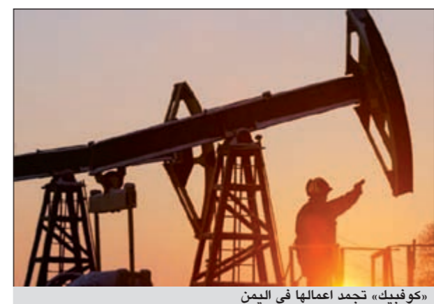
«كونفيك» تجمد أعمالها في اليمن

وبصفة مستمرة على تقييم أعمالها في الأماكن التي تتواجد فيها وهو التقييم الذي أدى إلى اتخاذ قرار تجريد كافة الأعمال نظراً لعدم جدواها الاستثمارية والتي لا تتوافق مع طموحات المؤسسة الاستراتيجية 2030.