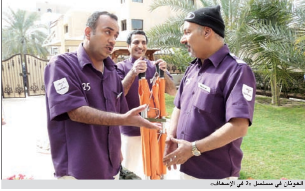
العونان في مسلسل «2 في الإسعاف»