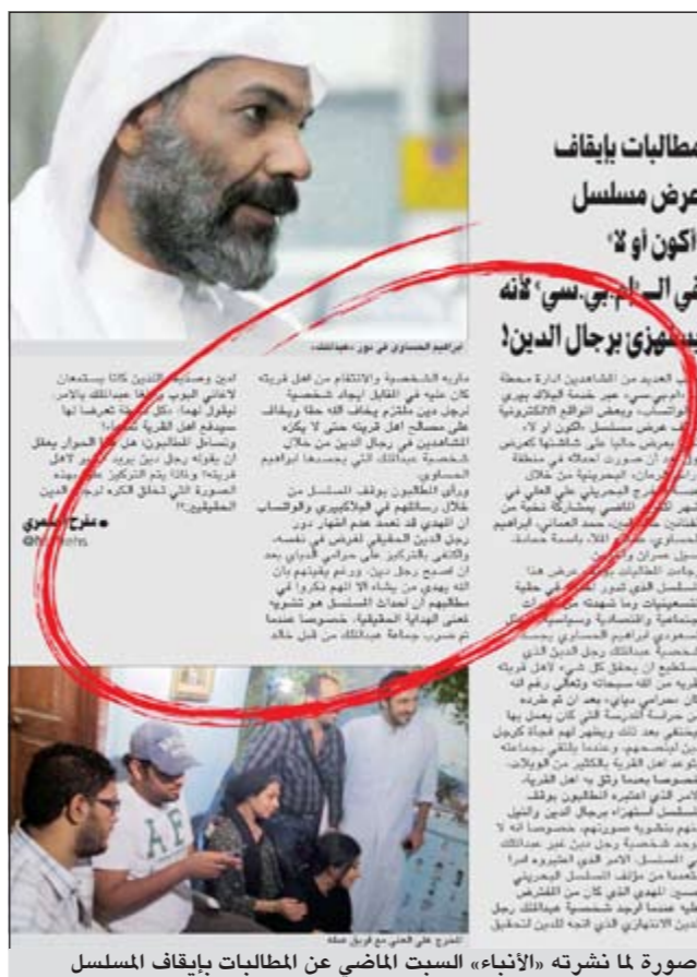
صورة لما نشرته «الانباء» السبت الماضي عن المطالبات بإيقاف المسلسل