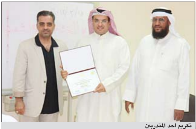
تكريم احد المتدربين

العلاج. وذكر الخياط انه تم تخريج عدد 60 متدرباً ومتدربة، وقام الخياط بتوزيع الشهادات على المتدربين والمتدربات.