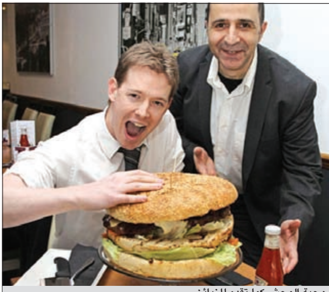
وجبة الوحش كما تقدم للزبائن

وأضاف: «لقد تحدثنا إلى بعض من عملائنا ليجتازوا التحدي ولا اعتقد أن هناك شخصاً يستطيع الانتهاء من الساندويتش». وذكرت الصحيفة أن المطعم يطلب من أولئك الذين هم على استعداد للقيام بالتحدي أن يخبروا المطعم لإعطاء الطهاة مهلة 24 ساعة حتى يستطيعوا الانتهاء من طهيها».