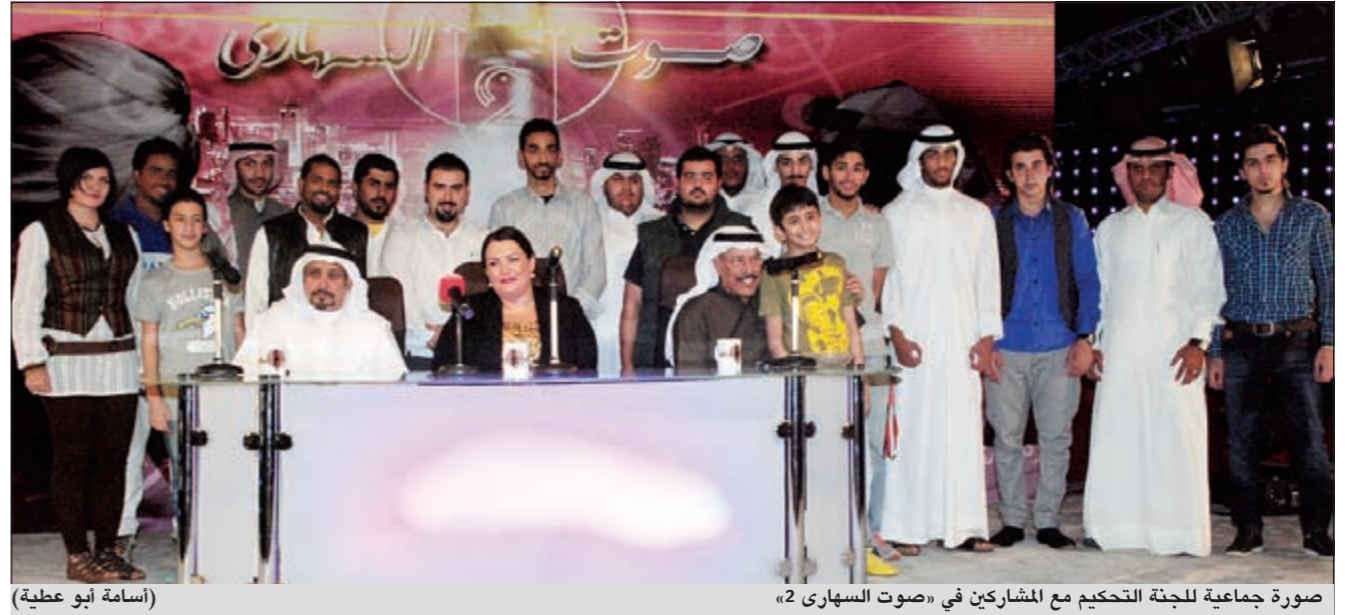
صورة جماعية للجنة التحكيم مع المشاركين في «صوت السهاري 2» (إسماء أبو عطية)

وقد مثل المطرب الشعبي امام المحكمة ومعه محاميه، وتحصدت بطريقته المعروفة أمام المحكمة، وقررت المحكمة منحه أجلاً للتصالح مع مصلحة الضرائب.