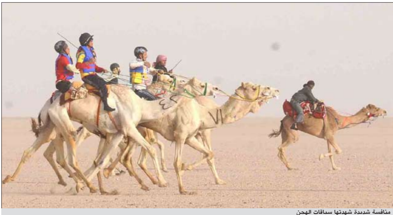
منافسة شديدة شهدت سباقات الهجن

تنطلق اليوم البطولة النسائية الاولى لكرة الطاولة بجماعة نادي الفتاة بمنطقة الخالدية بمشاركة لاعبات من اندية الفتيات الثلاثة وهي: سلوى الصباح والفتاة والعبون، وقالت رئيس الاتحاد الرياضي النسائي الشبيخة نعيمة الاحمد ان منافسات كرة الطاولة ستكون بداية لانطلاق البطولات والتي ستقام تباعا