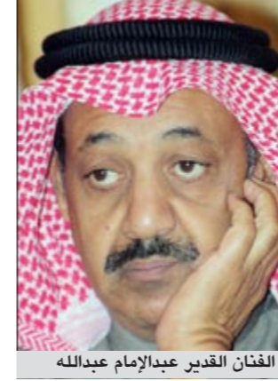
الفنان القدير عبدالإمام عبدالله

تستضيف الإعلامية مي العياد الليلة في حلقة جديدة من برنامجها «نأسف لعدم الإزعاج» الفنان القدير عبدالإمام عبدالله في حوار نقدي حول تجاربه الفنية ونقلاته والتحويلات التي طرأت على رحلته الفنية من مرحلة السبعينيات مروراً بالثمانينيات التي تسببها بالمسلسلات وحتى التسعينيات إلى المرحلة الحالية ومراسل الصعود والنزول بمشواره الفني، هذا بالإضافة إلى أنها تقوم بإستضافة الفنانة