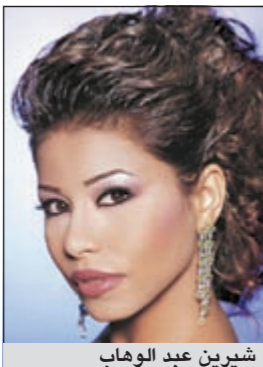
شيرين عبد الوهاب

انتهزت شيرين عبد الوهاب فرصة وجودها في لبنان لتصوير برنامج «تاراتانا»، قامت الفنانة المصرية بترشيح نسمة محبوب نجمة «ستار أكاديمي 8» للظهور معها في البرنامج. وكانت شيرين قد قامت بدعم نسمة خلال مشاركتها في «ستار أكاديمي»، وأشادت بها على المسرح، وأكدت أنها تكن لها محبة خاصة، كما هنأتها على فوزها باللقب. وتتواجد شيرين حالياً في بيروت حيث أحييت حفل زفاف ابنة فضل شاكر الذي تربطها به صداقة قوية.