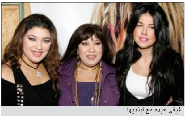
فيفي عبده مع ابنتها

الابنة الكبرى ليفي وهي تشبهها في الملامح. ويشارك فيفي بطولة الجزء الثاني كل من نبيلة عبيد، وأحمد دبير، ودينا فؤاد، وآتين عامر، وميمي جمال. والعمل من تأليف حسين مصطفى محرم، وإخراج أحمد البدرى.