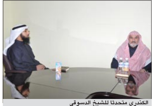
الكندري متحدوا للشيخ الدسوقي

إبرازاً للدور الريادي للكويت في نشر الأسانيد القرآنية الصحيحة والاهتمام بالقرآن الكريم، استضافت إدارة شؤون القرآن بوزارة الأوقاف المقرئ العلامة محمد بن إبراهيم الدسوقي من مصر الذي اشتهر بعلو السند في القراءة.