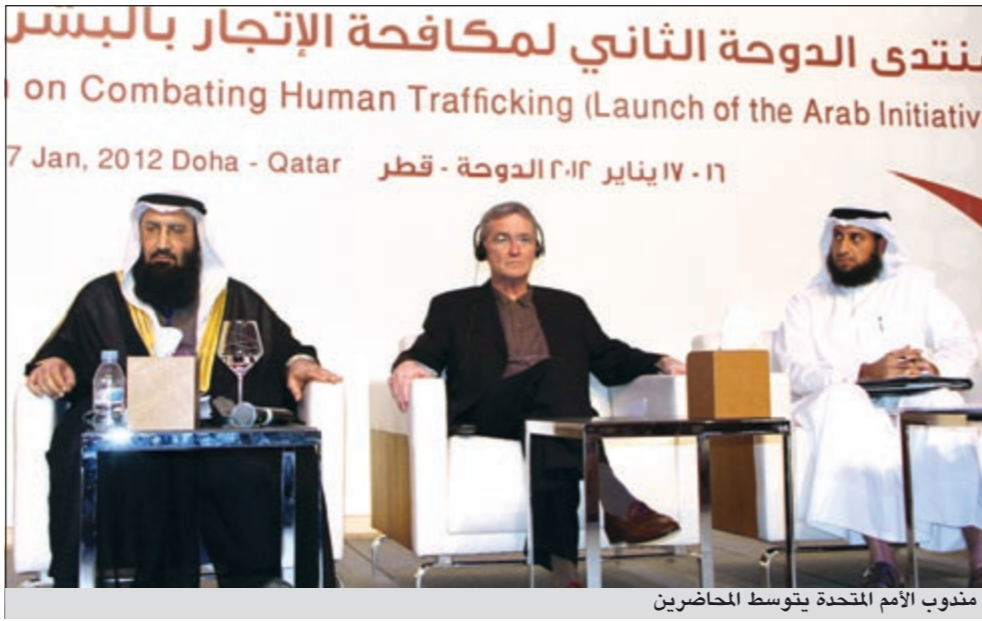
منوب الأمم المتحدة يتوسط المحاضرين

● عن طريق إعداد برامج توعوية شاملة حول خطورة ظاهرة الاتجار بالبشر وسبل مكافحتها والتأكيد على المبادئ والقيم الدينية في دعم الجهود الرامية للمكافحة، وأمانة نقل المعلومات وتسهيل الحصول عليها وأيضاً