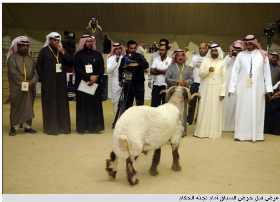
عرض قبل خوض السباق أمام لجنة الحكام

ودعا الشيخ صباح الأسر الكويتية إلى التواجد في منطقة الروضتين لحضور هذه المسابقات التراثية الجميلة والتي تعيد للجمع التكريات الجميلة لحياة أهل البادية قديماً في الكويت والجزيرة العربية.