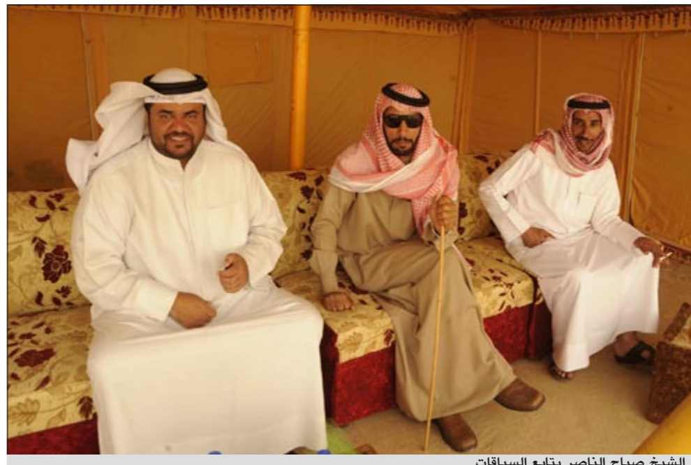
الشيخ صباح الناصر يتابع السباقات

الألقاب على المستوى الخليجي نظرا لما يملكونه من إبل غاية في الجمال.