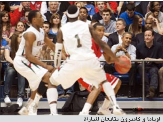
اوباما وكامبيرون يتابعان المباراة

أعلنت زوجة الرئيس الأميركي ميشال اوباما خلال لقاء مع زوجة رئيس الوزراء البريطاني سامنتا كامبيرون أنها ستقود الوفد الأميركي إلى دورة الألعاب الأولمبية في لندن. وستتوجه اوباما إلى لندن للمشاركة في حفل افتتاح الدورة التي تنطلق في 27 يوليو المقبل. وستشكل هذه المشاركة فرصة لها للحديث عن حملتها «لبئس موف» التي تهدف إلى مكافحة البدانة لدى الشباب الأميركي. من جانب آخر، اصطحب الرئيس باراك اوباما رئيس الوزراء البريطاني ديفيد كامبيرون إلى المدرجات لمشاهدة مباراة في كرة السلة ضمن بطولة الجامعات وذلك في إطار حملته الرئاسية في ولاية اوهايو.