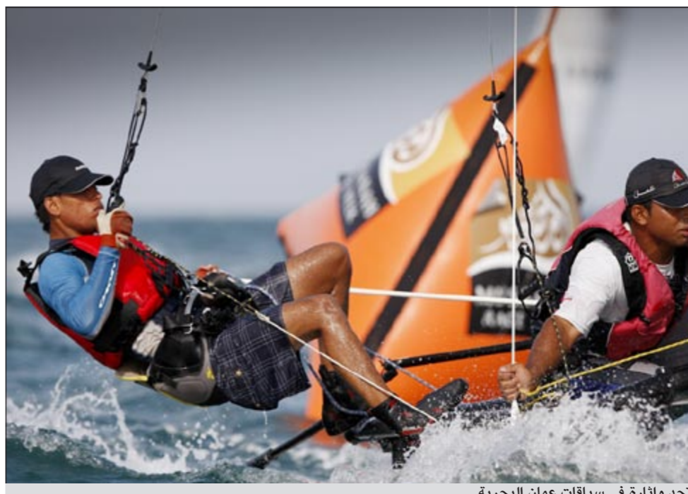
تحد وإثارة في سباقات عمان البحرية

انطلقت أولى سباقات أسبوع المصنعة للإبحار الشراعي الذي ينظمه مشروع عمان للإبحار بالمدينة الرياضية بالمصنعة بمشاركة 160 بحاراً وبحارة من داخل السلطنة ومن دول مختلفة تمثل الشرق الأوسط وآسيا وأوروبا والولايات المتحدة الأميركية والبحرين وانجلترا والدنمارك وهولندا وفرنسا وألمانيا للمنافسة في 8 فئات من الفئات الأولمبية (الدنجي) للقوارب الشراعية. وبدأت أنشطة الأسبوع اليوم الاوول بحلقات عمل لفئتي الليزر والهوبي 16 منذ يومين (12 و 13 الجاري) والتي قدمها محاضرون محترفون لهم باع طويل في مجال الإبحار الشراعي، وفي مقدمتهم كون دي كوينغ الذي يعد قوة ضاربة في عالم الإبحار الشراعي (بطل العالم) والذي سيكون ضمن فريق التدريب نيكولاس نومسون الذي حقق