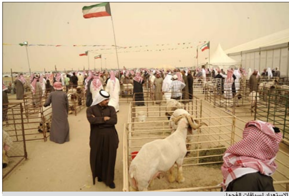
الاستعداد لسباقات الفحول