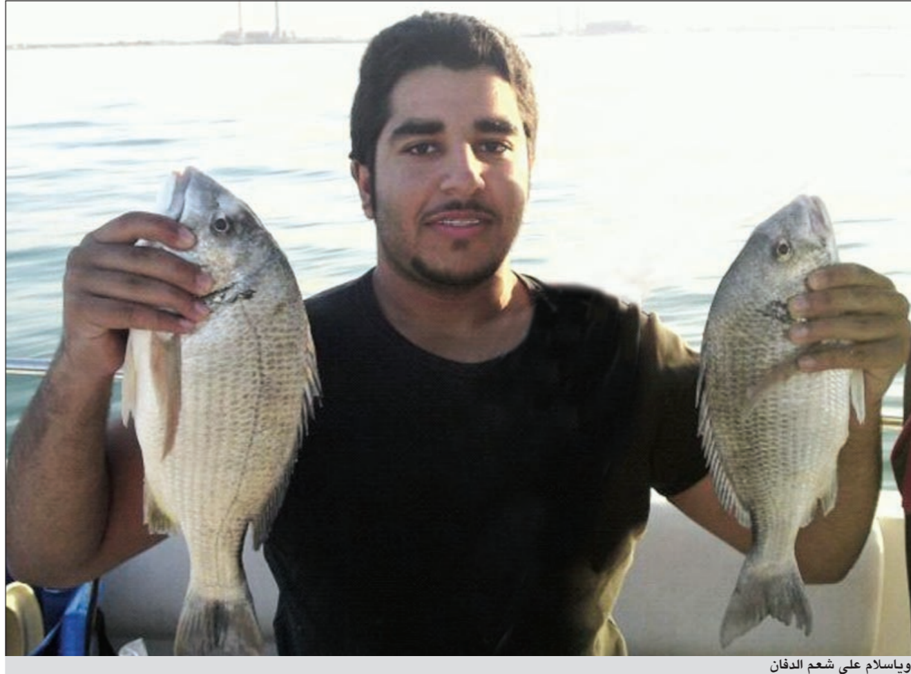
وياسلام على شعم الدفان

البحر له احباب كثير فيالكويت والخليج والعالم نجد من يذهب اليه لطلب الرزق او لممارسة هواية بحرية او للتنزه على شواطئه الجميلة والاستمتاع بتسمات هوائه العليل، كل هذا اجتمع في حب واحب هو البحر، فقد توارت الاجداد والاباء مهنة الصيد والتجارة متحدين الامواج بسلاحهم من الايمان والعزيمة، ورغم تطور الزمن وتحديث المدن وكل شيء جديد في جديد وانشغال الناس بأعمالهم فان الحب الاول كما يقولون ينبض في القلب.