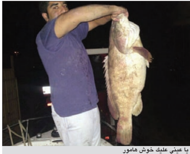
يا عيني عليك خوش هامور

● اولا احب ان اقول ان لكل محدق موسما ووقتا معينا للصيد ويكون فيه الصيد ولا اروع هذا من ناحية ومن ناحية اخرى فان اختيار المحدق او القوعة لا يأتي من فراغ انما يأتي من ممارسة وخبرة فهناك تجد اناسا خبرتهم بسيطة واغلب رحلات صيدهم تكون بصيد قليل من