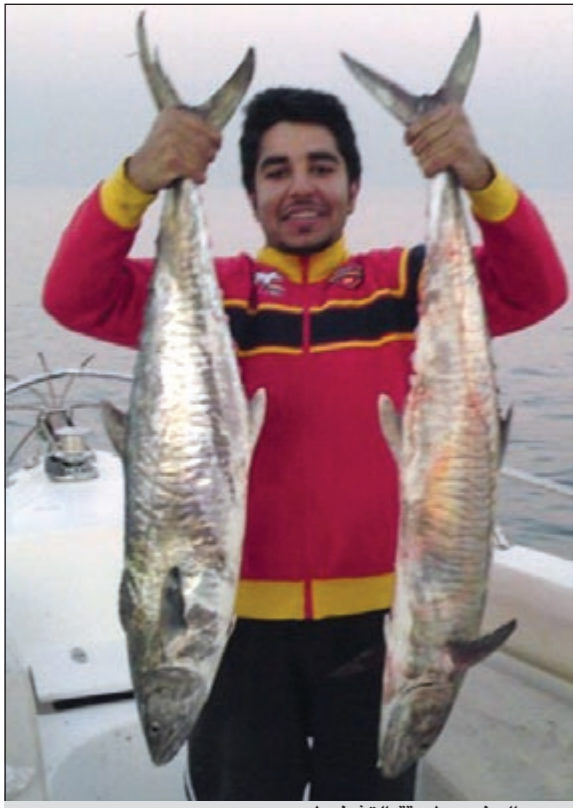
صيد الجنعد بطريقة التشخيظ

● نعم هذا صحيح فالتنوع بطرق الصيد كما نكرت في السابق يعطي فرصة أكبر للحدائق أو الهاوي بتحديد مستواه، فطرق الصيد مختلفة ومتنوعة وسابداً باول طريقة وهي الحدائق العادية «الخيظ» والصيد بهذه الطريقة