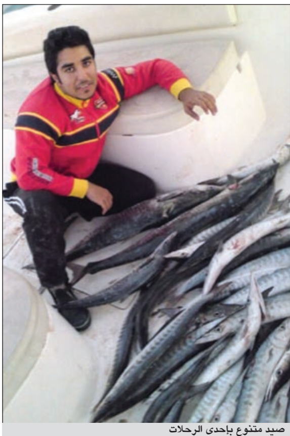
صيد متنوع بإحدى الرحلات