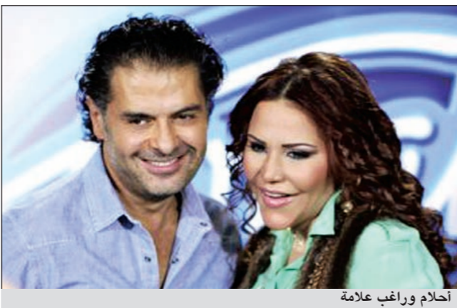
أحلام وراغب علامة

أيضا استغرب عدد كبير من معجبي المغربية دنيا بطما هجوم أحلام عليها في حلقة الجمعة الماضية بعدما أدت أغنية أصالة «أكثر من اللي أنا بحلم فيه»، بالغت أحلام في انتقادها قائلة إنها لم تكن على المقام، معتبرة أن هذه الأغنية تقدم في الاستوديو فقط ولا تصلح للغناء الـ«لايف»، وهو الأمر الذي فسره عدد كبير من جمهور أصالة بأن أحلام فضت جمهور أصالة السورية ولمحة إلى أن أغنيتهما يتم تحسيدهما في الاستوديو، ولا تصلح للغناء على المسرح.