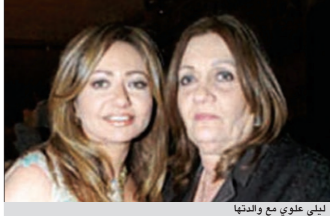
ليلي علوي مع والدتها

كذلك الأمر بالنسبة إلى يسرا التي تعتبر والدتها أهم وأغلى إنسان في حياتها، خصوصا أن الفنانة المصرية وحيدة من دون أشقاء، وبالتالي تعتبر والدتها أمها وأسرتها وأصدقائها بل أولادها الذين لم تنجبهم، معتبرة أن حياتها تمثل لها العمود الفقري في حياتها لأنها حملت همومها وتعبت في تربيته، وأرجعت سبب نجاحها إليها، وقالت إنها خلقت