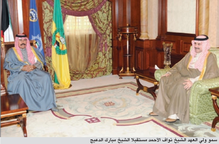
سمو ولي العهد الشيخ نواف الأحمد مستقبلاً الشيخ مبارك الدعيج

واستقبل سموه بقصر بيان صباح أمس رئيس مجلس الإدارة المدير العام لوكالة الأنباء الكويتية (كونا) الشيخ مبارك الدعيج.