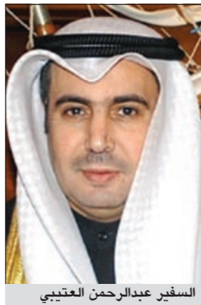
السفير عبدالرحمن العتيبي

حريصون على بحث جميع امكانيات التخفيف عن الشعب الياباني لذلك لم يكن غريباً ان يعطي صاحب السمو الأمير أوامره السامية فور وقوع الكارثة بتقديم مساعدات عاجلة لحكومة اليابان ثم قراره المتعلق بتقديم منحة من النفط الخام تبلغ 5 ملايين برميل تزيد قيمتها على 500 مليون دولار وذلك للتخفيف من معاناة أسر الضحايا». وأكد السفير العتيبي انه كان لهذه المنحة صدى جيد لدى جميع الأوساط اليابانية اميراطورا وحكومة وبرلمانا وشعباً تتلخص جميعها بالشكر والتقدير لهذا الموقف الإنساني النبيل من صاحب السمو الأمير والشعب الكويتي مؤكداً ان هذه المساهمة تعبر عن مواقف الكويت المشرفة. وأعرب عن اعتقاده بان هذه الزيارة ستمثل أيضاً دفعة قوية لتعزيز التعاون بين البلدين في العديد من المجالات خصوصاً في مجالات التجارة النفطية والاستثمارات المشتركة والتعاون التكنولوجي والبيئة والصحة والثقافة والتعليم والبحث العلمي. وقال السفير العتيبي ان العلاقات الكويتية - اليابانية تمر بمرحلة من ازدهار مرحلتها «ونحن نرى ان اليابان أحد اهم وأفضل أصدقائنا في