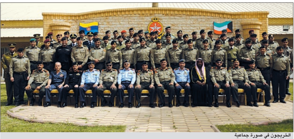
الخريجون في صورة جماعية

الخبيرات التي تعود بالنفع على الجميع». وكان الحفل قد بدأ بكلمتين لأمر مدرسة الامداد والتموين وأمر مدرسة الإشارة قداماً خالهما نبذة عن المناهج والدروس النظرية والتدريبات العملية التي تلقاها منتسبوا الدورات خلال فترة دراستهم.