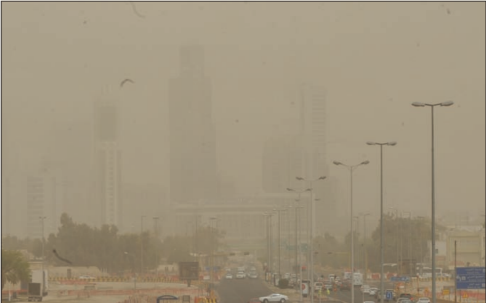
موجة الغبار اخفت ملامح بنايات العاصمة (متين غوزال)