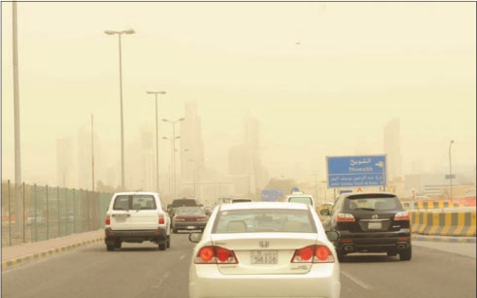
الرؤية انخفضت إلى مستويات متدنية في المناطق البرية (محمد ماهر)