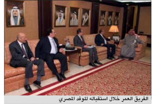
الفريق العمر خلال استقباله للوفد المصري

استقبل وكيل وزارة الداخلية الفريق غازي العمر في مكتبه بمقر وزارة الداخلية صباح امس السفير أحمد راغب مساعد وزير الخارجية المصرية للشؤون القنصلية والوفد المرافق له من السفارة المصرية بدولة الكويت بحضور مدير عام الإدارة العامة لمكتب وكيل الوزارة اللواء عصام عبدالعزيز العمر. ورحب الفريق العمر بضيفه والوفد المرافق له مؤكدا عمق العلاقات الأخوية الراسخة بين البلدين الشقيقين الكويت وجمهورية مصر العربية والتي تضرب بجذورها في أعماق التاريخ.. ومعبا عن ارتياحه للتطور المستمر في دعم العلاقات في المجال الأمني بين الجانبين. وتم خلال اللقاء تبادل الأحاديث الودية وعدد من الموضوعات ذات الاهتمام المشترك. من جانبه، توجه السفير أحمد راغب بالشكر والتقدير لدولة الكويت على حسن رعايتها لأبناء الجالية المصرية.