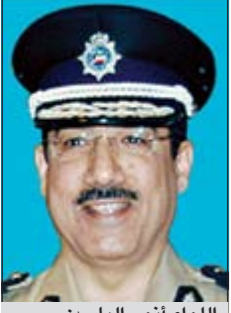
اللواء أنور الياسين

وأشاد لدى افتتاحه صباح اول من امس دورة التدريب الامنية الوكاية برعاية وإشراف مركز التدريب التخصصي لأمن المنافذ والإدارة العامة لأمن المطار وبمشاركة من إدارة امن النقل الاميركية والسفارة الاميركية بالكويت بالتعاون المتفر والنهء بمجال الامن الوقائي والتدابير الامنية مع جميع الدول الصديقة، مشيرا الى دور الولايات المتحدة الاميركية كحليف استراتيجي، والتعاون المتفر معها بشتى المجالات. وأثنى اللواء الياسين على جهود السفارة الاميركية بالكويت، وبادارة أمن النقل الاميركية لدورها الحيوي وجهودها الجيدة من أجل العمل على إقامة وإنجاح تلك الدورات والتي ستسهم حتما في رفع كفاءة العاملين بأمن المطار.