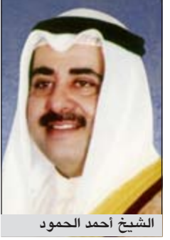
الشيخ أحمد الحمود

يغادر البلاد اليوم النائب الأول لرئيس مجلس الوزراء ووزير الداخلية الشيخ أحمد الحمود على رأس وفد أمني رفيع المستوى متوجها إلى الجمهورية التونسية للمشاركة في اجتماع الدورة التاسعة والعشرين لمجلس وزراء الداخلية العرب المقرر عقدها في العاصمة التونسية خلال الفترة من 13 إلى 15 الجاري.