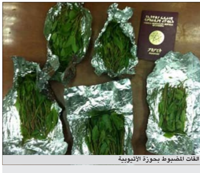
القات المصبوت بجوزة الأيوبية