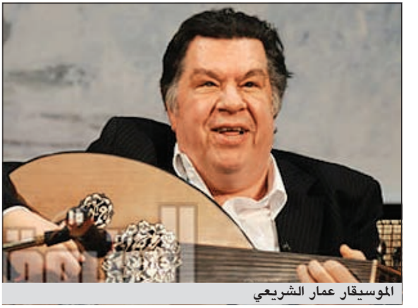
الموسيقيار عمار الشريعي

يرقد الفنان الكبير الموسيقار عمار الشريعي الآن في العناية المركزة بأحد مستشفيات المهندسين بعد تعرضه لوعكة صحية اضطر على إثرها للتوجه إلى المستشفى لإجراء مجموعة من الفحوصات الطبية العاجلة.