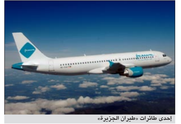
إحدى طائرات «طيران الجزيرة»

وتتوافق هذه الخدمة في مطار الكويت الدولي حاليا، وسيتم توفيرها على جميع شبكة الشركة في الأشهر المقبلة. وتعتبر هذه الخدمة