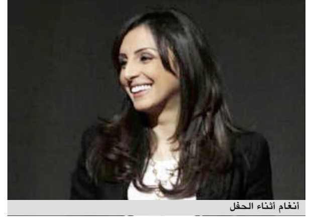
أنغام أثناء الحفل

أقامت الأمم المتحدة في دار الأوبرا المصرية حفلا لتكريم عدد من أمهات مصر من بينهن الفنانة أنغام، التي قامت بغناء أغنية جديدة لها بعنوان «نصف الدنيا» كلمات والحنان أمير طعيمة، وقد أنجزت خصوصا بمناسبة يوم المرأة العالمي وعيد الأم. ولم تؤد أنغام الأغنية «لايف»، بل كانت مسجلة «بلاي باك»، فالأغنية تمت كتابة كلماتها والانتهاؤها منها خلال 18 يوما فقط.