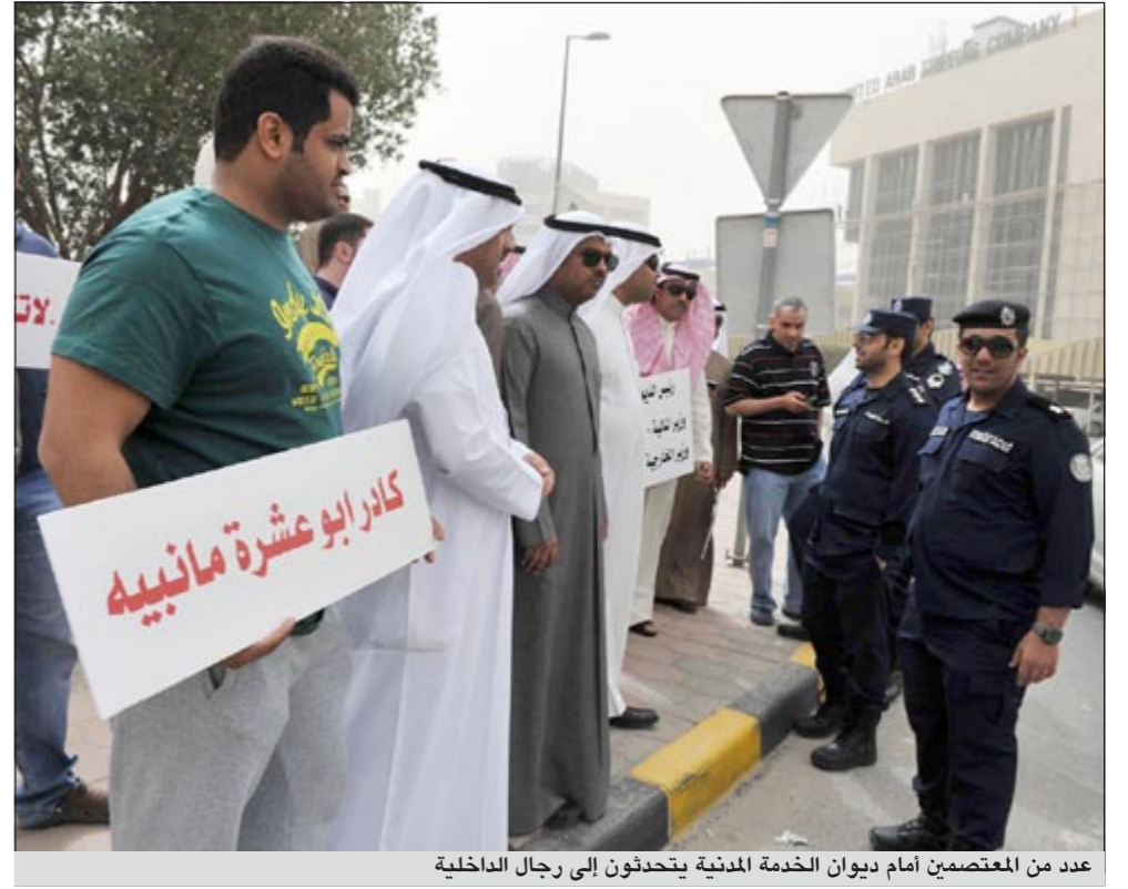
عدد من المعتصمين أمام ديوان الخدمة المدنية يتحدثون إلى رجال الداخلية