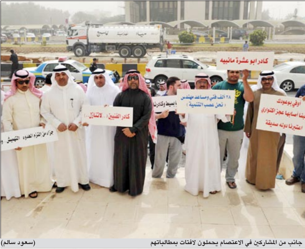
جانبا من المشاركين في الاعتصام يحملون لافتات بمطالباتهم (سعود سالم)