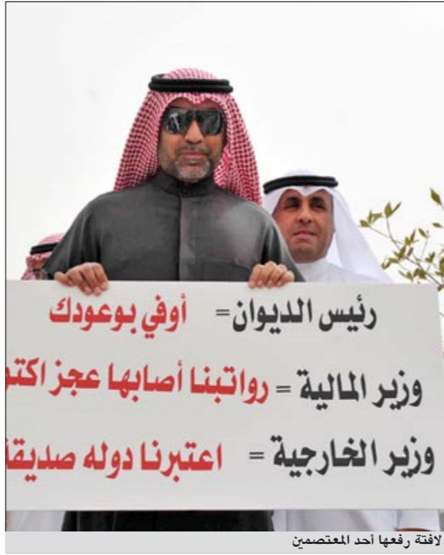
لافتة رفعها أحد المعتصمين