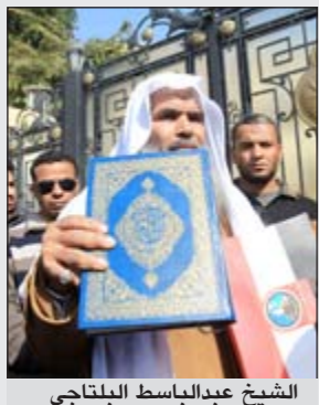
الشيخ عبدالباسط البلتاجي