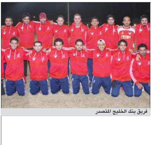
فريق بنك الخليج المتصدر

احتفظ فريق بنك الخليج بصدارة الدور الأول لقائمة دوري قدم نادي مصارف الكويت بعد فوزه على فريق بنك الوطني 0-4 في السبوع السابع من المسابقة على ملاعب وزارة الإعلام ضمن بطولة دورة كرة القدم والتي ينظمها نادي مصارف الكويت للبنوك الأعضاء. ويتصدر «بنك الخليج القائمة ب» بـ 16 نقطة فيما يحتل بنك بوبيان المركز الثاني بـ 13 نقطة بعد فوزه على بيت التمويل بهذين مقابل هدف وجاء في المركز الثالث فريق بيت التمويل بـ 10 نقاط. وفاز فريق البنك الدولي على فريق البنك الأهلي المتحد 1-2. وتطلق في الثامنة والنصف من مساء اليوم الأحد على ملاعب وزارة الإعلام لقاءات الدور الثاني وذلك بقاء يجمع بين بيت التمويل والبنك الأهلي المتحد، فيما يتقابل غداً البنك الدولي مع بنك بوبيان وبعد غد مع بنك الخليج مع البنك الأهلي وتختتم اللقاءات الأربعاء المقبل بقاء يجمع بنك الكويت الوطني وفريق البنك الأهلي المتحد.