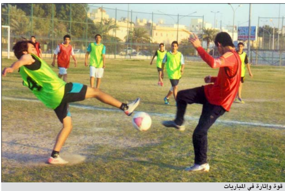
قوة وإثارة في المباريات

فريق شنفا لقب بطل المحافظة لمبارك الكبير للبراعم لكرة القدم وادبرت المباريات بطاقم حكام من اتحاد الكرة.