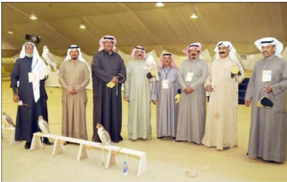
الاستعداد قبل مسابقة الصقور