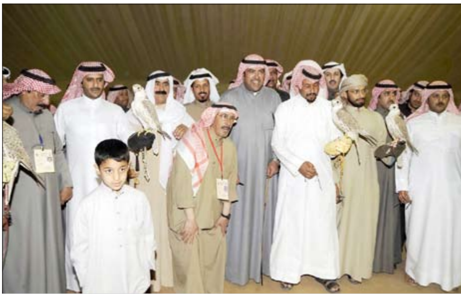
الشيخ ضاري الفهد مع أصحاب المراكز الأولى لمسابقة الصقور