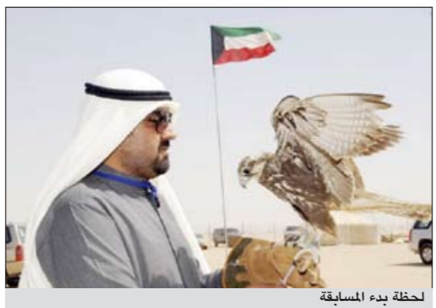
لحظة بدء المسابقة

من جانبه أكد رئيس اللجان المنظمة لمهرجان الموروث الشعبي الشيخ صباح فهد الناصر أن المسابقات تسير حسب الجداول الزمنية الموضوعة لها، قائلاً: لقد انتهينا من مسابقات الإبل المخصصة لفئة الأحمر 30 و50 والفردى، موضحاً أن تنظيم المهرجان بشكل جيد ساعد على عدم وجود أي اعتراضات من قبل