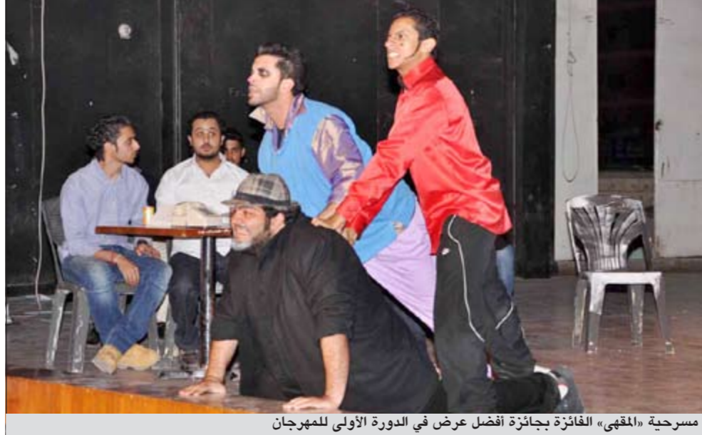
مسرحية «المهي» الفائزة بجائزة أفضل عرض في الدورة الأولى للمهرجان

تأكيد مشاركتها من قبل الجهات المسؤولة عنها. وتمنى عميد المعهد العالي للفنون المسرحية د. فهد السليم أن تحقق الدورة الثانية للمهرجان الهدف المرجو من إقامتها بعد أن خلّت الدورة الأولى من أي مشاركة خارجية، موجهاً شكره لوزير التربية ووزير التعليم العالي د. نايف الجحرف على اهتمامه باستمرارية هذا المهرجان، والشكر موصول لجميع الأساتذة والدكاترة في المعهد الذين يبذلون قصارى جهدهم لإخراج هذه الدورة بالصورة المطلوبة.